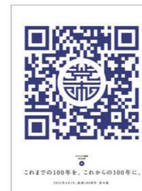
2021.4.1山陽新聞全面広告

今回お邪魔した『株式会社荒木組』は、岡山県内を中心に建築・土木工事の設計、施工を手がける総合建設会社。品質に徹底的にこだわる証として、現場事務所や社屋前に品質旗「匠魂」を掲げているのが印象的でした。2021年4月1日には 創業100周年という大きな節目 を迎えられました。「これまでの100年を、これからの100年に。」というキャッチコピーとともに掲載された新聞広告を目にされた方もいらっしゃるでしょう。紙面のQRコードを読み取ると現れるPR動画には、「私たちの仕事は協会社の皆さまがいなければ成しえないこと。だからこそ、お互いに高め合い、岡山の建設業界の未来を一緒につくっていききたい」という決意が込められています。