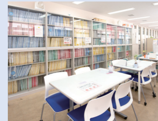
取材へのご協力: ノートルダム清心女子大学 キャリアサポートセンター センター長 鷺江 健治様

大学を取り巻く社会の変化に柔軟に対応しながら、教職員間の連携を強化して学生たちとの接点を増やし、就職に対する疑問や悩みに寄り添えるよう取り組んでまいります。